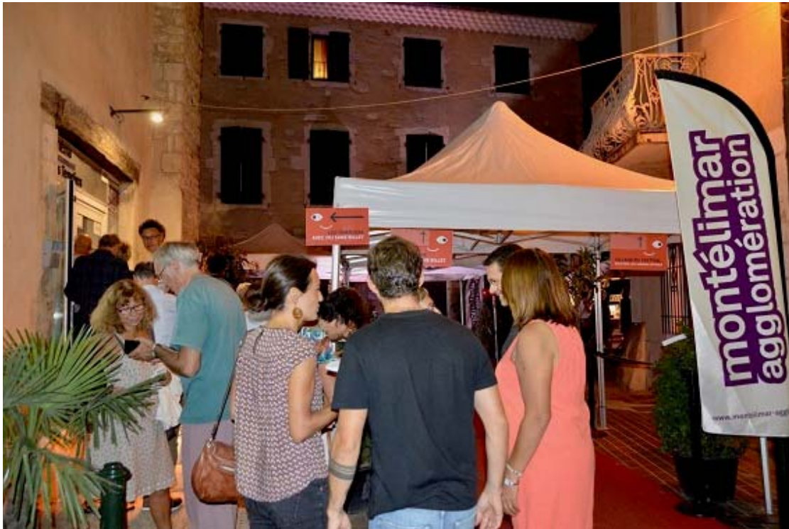
Ambiance nocturne du festival à Montélimar.