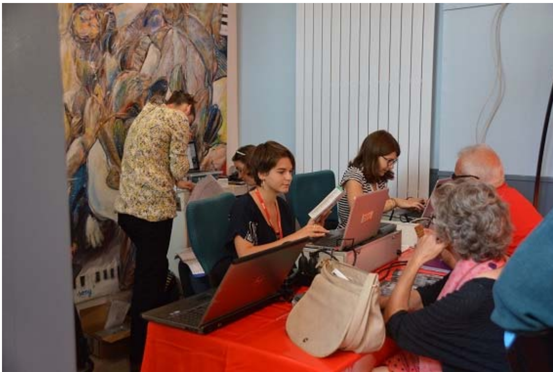
Coup de chauffe aussi à l'ouverture de la billetterie mercredi matin à 10h.

+ Share / Save f t s (https://www.addtoany.com/share?url=http%3A%2F%2Fwww.e-tribune.fr%2Findex.php%2Fmontelimar%2F13847-festival-de-l-ecrit-a-l-ecran-chiche-on-ose-le-bikini-aux-templiers&title=Festival%20De%20l%27%C3%A9crit%20%C3%A0%20l%27%C3%A9cran%20%3A%20Chiche%2C%20on%20ose%20le%20bikini%20aux%20Templiers%20%3F)