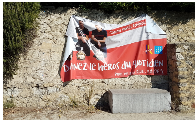
Affiche reposée provisoirement en attendant mieux