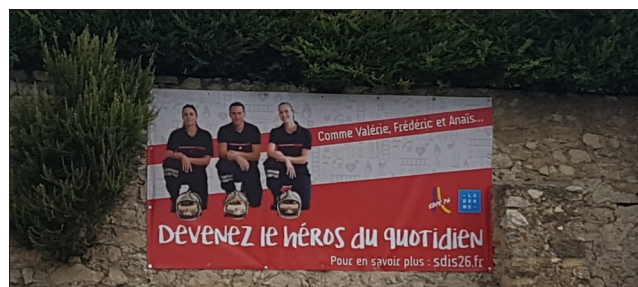
L'affiche avant dégradation.