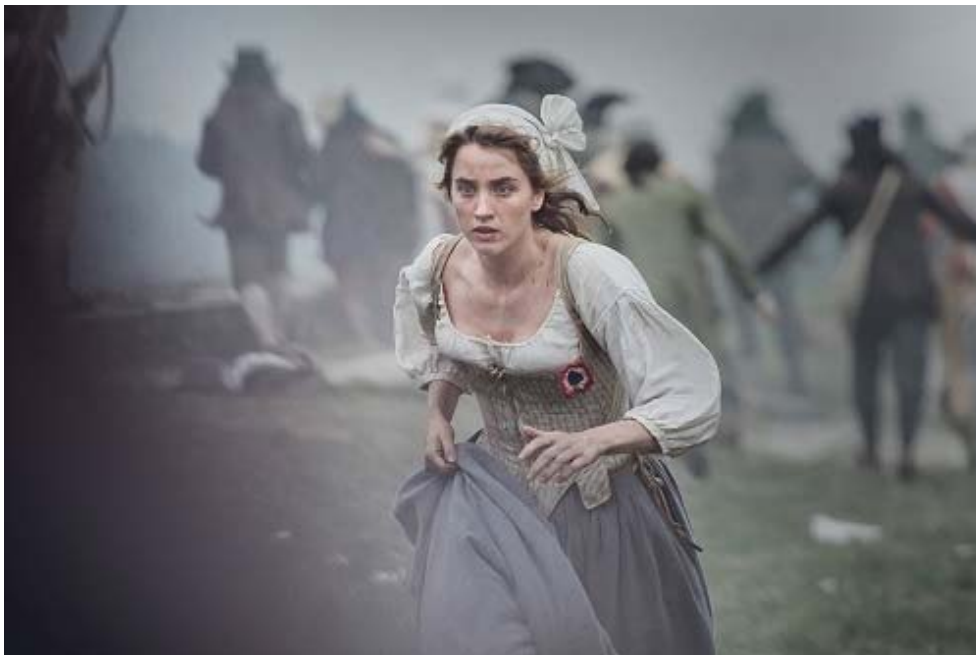
L'actrice Adèle Haenel qui joue le rôle de Françoise.

"Les enfants sont là dans la ville. Ils sont là dans la rue, ils travaillent. C'est un temps où si on ne travaille pas, on ne mange pas. Le peuple de Paris a traversé la Révolution, il est là à la Bastille, au Champs-de-Mars. La Révolution devient quelque chose de très humain et plus un cours d'Histoire. Aussi, il était très important qu'il y ait une sensibilité politique des femmes. Les comédiennes sont magnifiques. Les chants des femmes, c'est la vie, la jeunesse, la spontanéité...Je voulais le mettre au cœur du film".