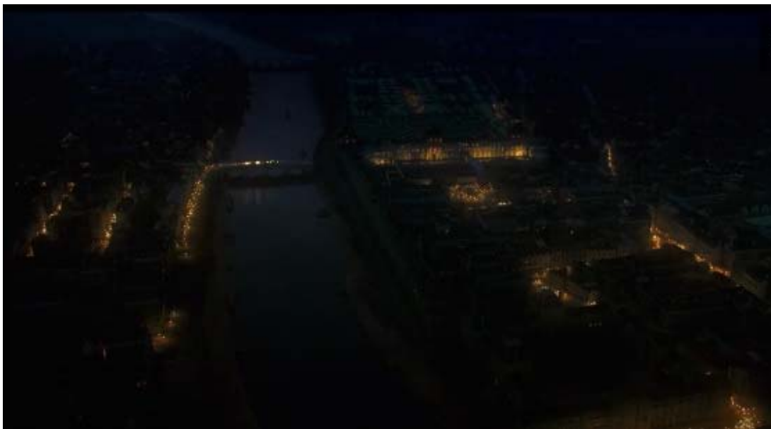
Certaines scènes du film ont été réalisées avec des effets spéciaux.

"Je ne sais pas. La politique appartient à tous. Il ne faut pas penser que la politique appartient à quelqu'un. Elle fait partie de la vie. Là, dans ce film, j'ai essayé de retrouver un sentiment de satisfaction, de montrer qu'on peut changer le monde, que l'égalité ce n'est pas un vain mot, qu'au contraire c'est un mot fort, tout comme la fraternité qui peut être un mot joyeux".