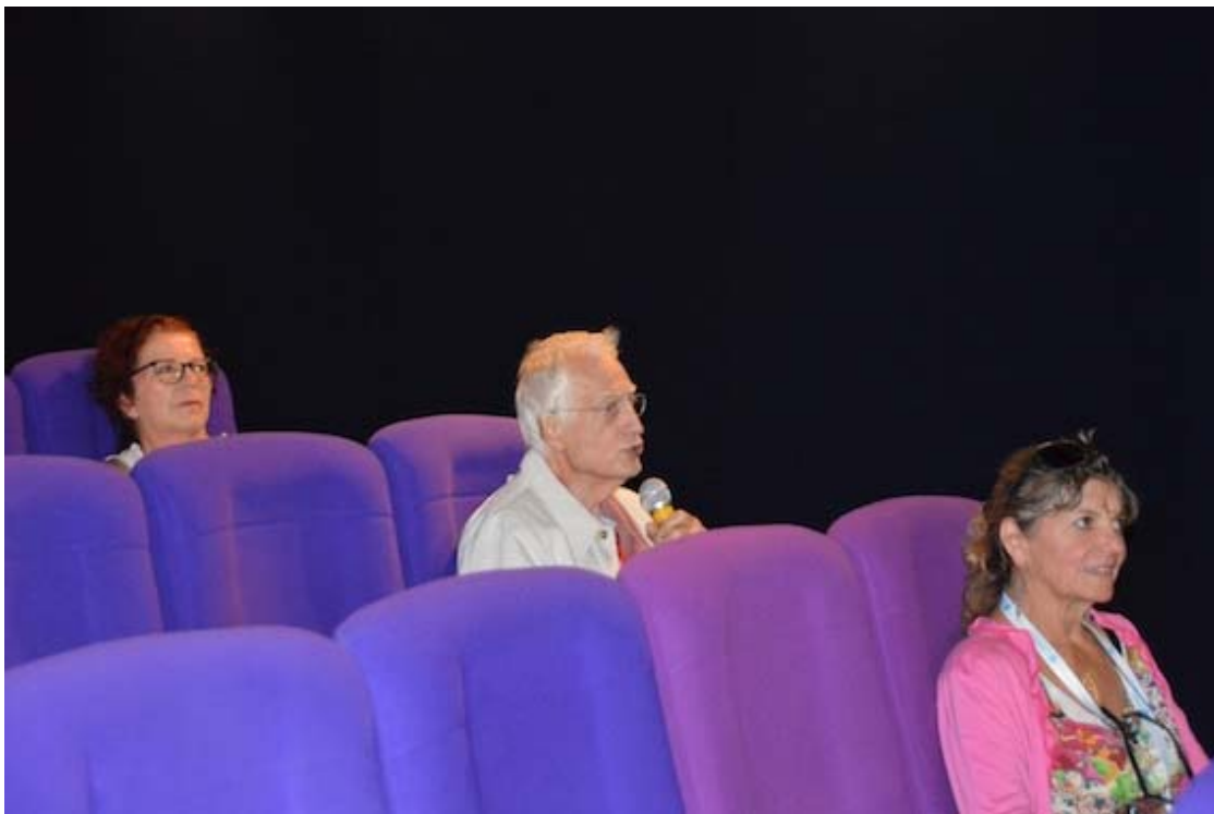
Bertrand Tavernier, invité d'honneur du festival, et là assis tout bonnement dans la salle... ça vous touche.