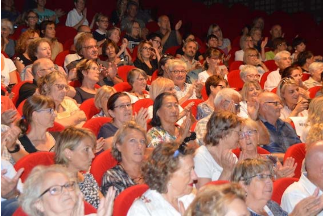
Le public à l'auditorium de Montélimar, pour le film "Un amour impossible".

Fallait-il alors que je m'inflige une souffrance supplémentaire avec « Cold War » ? La beauté de cet autre amour impossible est à couper le souffle, comme celle de l'actrice principale Joanna Kulig. Savoureuses prestations (trop brèves !) de notre Cédric Kahn drômois et de la somptueuse Jeanne Balibar. Alors non, aucun regret. Parce que le cinéma n'est pas que jouissance et jubilation. Parce qu'il est bon d'être secoué(e) parfois, révolté(e) ou mis(e) face à ses blessures.