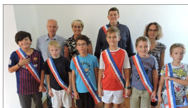
Les nouveaux conseillers juniors de la commune.