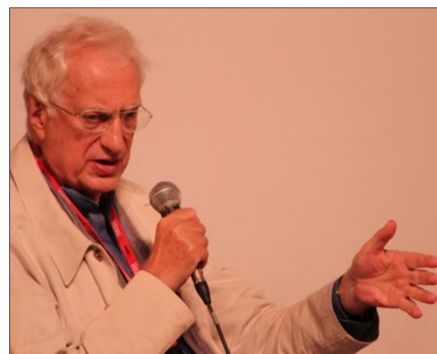
Bertrand Tavernier a fait passer un très bon moment au public.

Dans l'après-midi de vendredi, Bertrand Tavernier était présent sur la scène de l'auditorium du cinéma mais aussi son amour pour les réalisateurs et les acteurs.