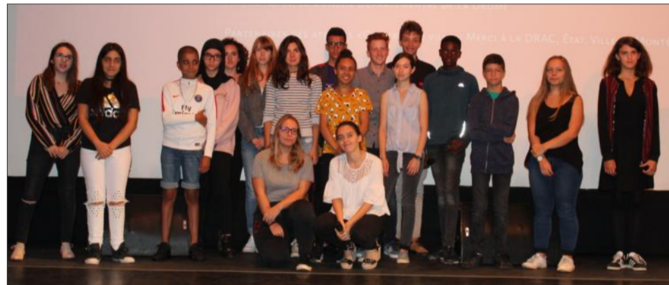
Les jeunes présents samedi matin à l'auditorium.

Durant la dernière année scolaire, l'association Del'écrit à l'écran a réalisé une dizaine de courts-métrages avec les élèves de divers établissements scolaires. Ils étaient tous invités à venir samedi matin à l'auditorium