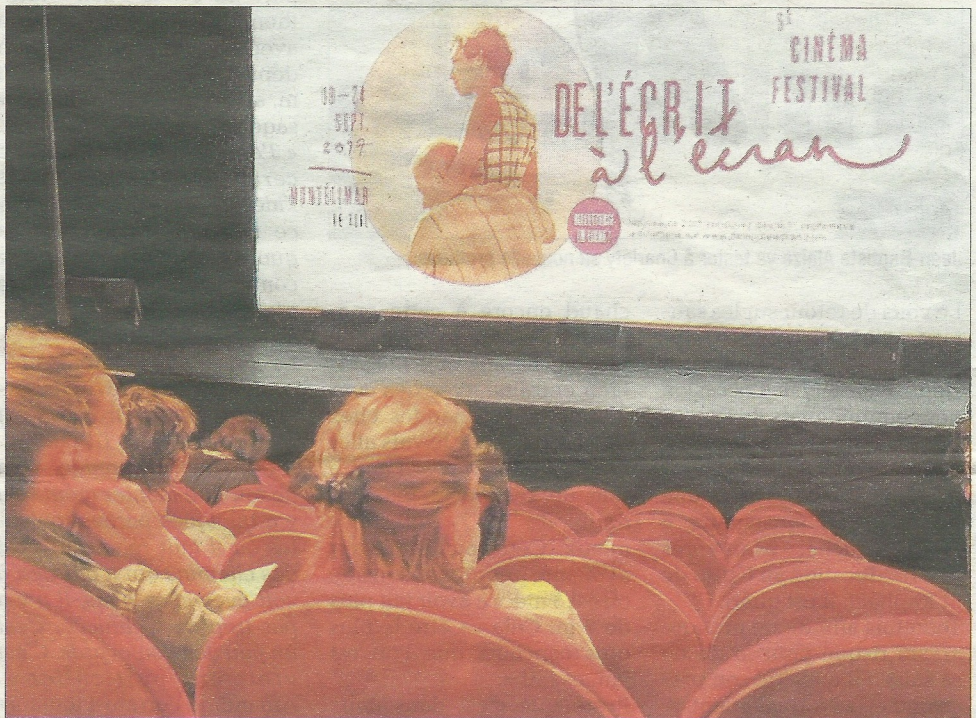
Le festival de l'Écrit à l'écran, c'est le rendez-vous des avant-premières et des rencontres artistiques. Mais c'est aussi des sets musicaux, des expositions... Un marathon sur 6 jours !

Autre invité que nous adorons, entre autres dans son rôle de Catherine dans « Une famille formidable »,